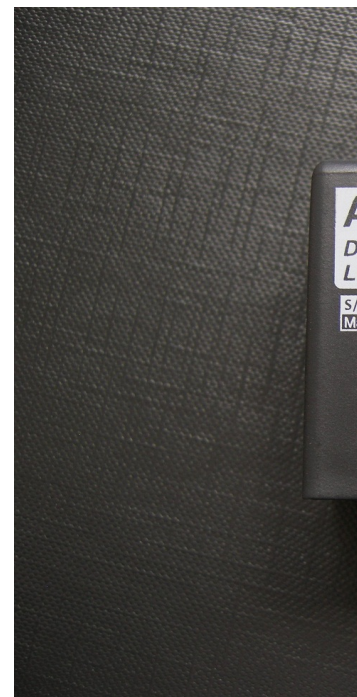
Czytelna Instrukcja Montażu

Prosta konfiguracja za pomocą darmowego programu serwisowego LepardService .